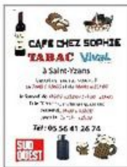
Bar Chez Sophie