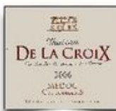
Ch.De la Croix