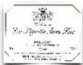
La Pigotte Terre Feu