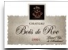
Ch.Bois de Roc