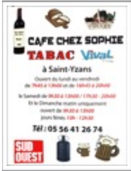
Bar Chez Sophie