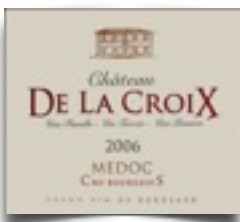
Ch.De la Croix

téléphone 09 67 59 95 81 / 06 34 95 08 90 ou courrier à G.Petermann, 40 rue de Rigon 33340 ST.YZANS avant le 18 mai 2018